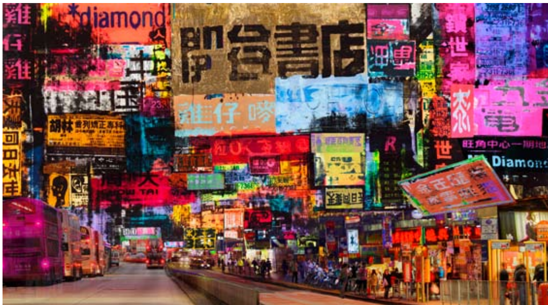
Tokyo, Love in Japan, 2015

ästhetische Elemente des Stadtbildes wie die charakteristischen Fassaden Sohos oder die gigantischen Billboards treffen auf Ikonen der amerikanischen Popkultur. Klassiker der Comicgeschichte wie Superman oder Batman fügen sich ganz selbstverständlich in die collageartigen Stadtansichten ein. Es entsteht ein assoziatives Bild der Metropole New York, das sich aus unzähligen medialen Überlieferungen und kollektiven Vorstellungen speist.