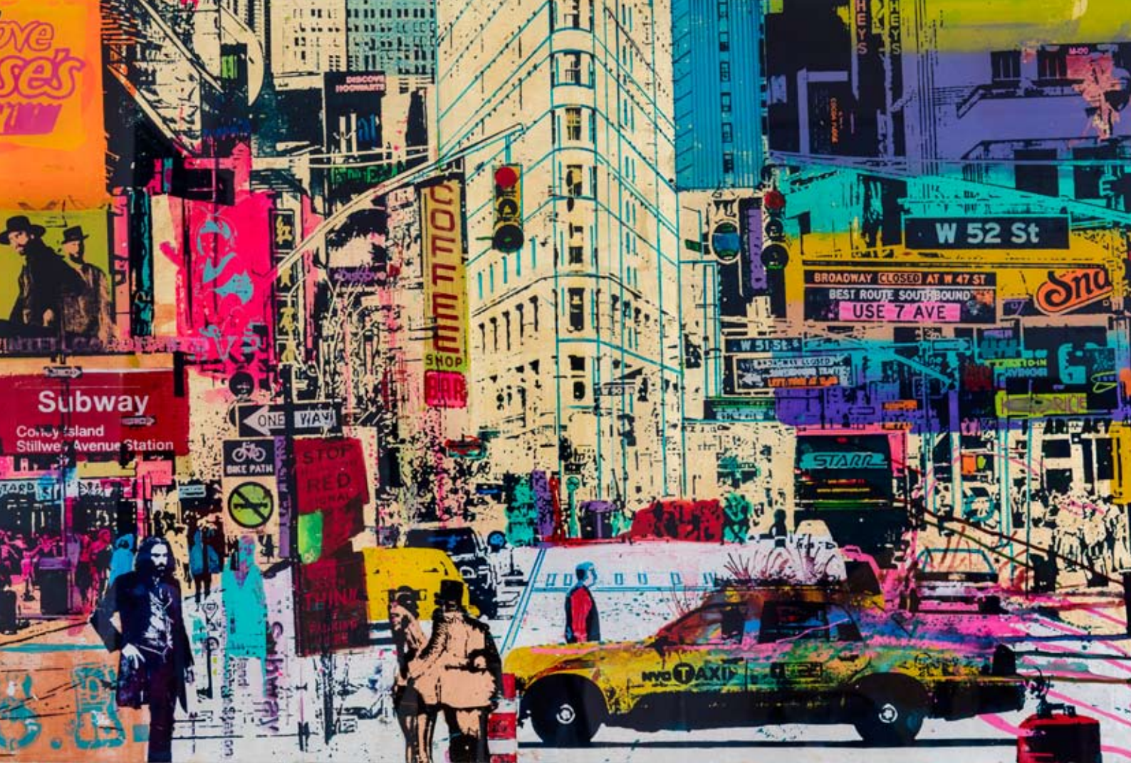
New York, Taxi, 2015